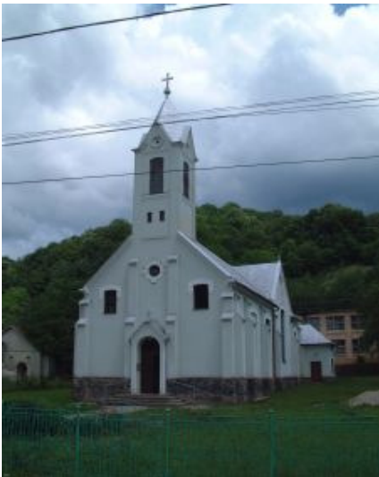
Biserica Catolica Nadrag (1928);