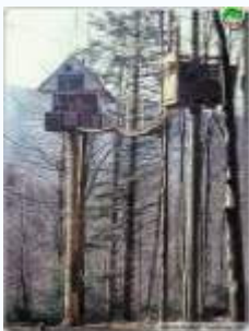
cuib de vulturi

Dintre pasarile prezentate în preajma Nadragului amintim: ciocanitoarea, cucul, gaita, pitigoiul, vulturi, cocosul de munte, cocosul de mestecan etc.